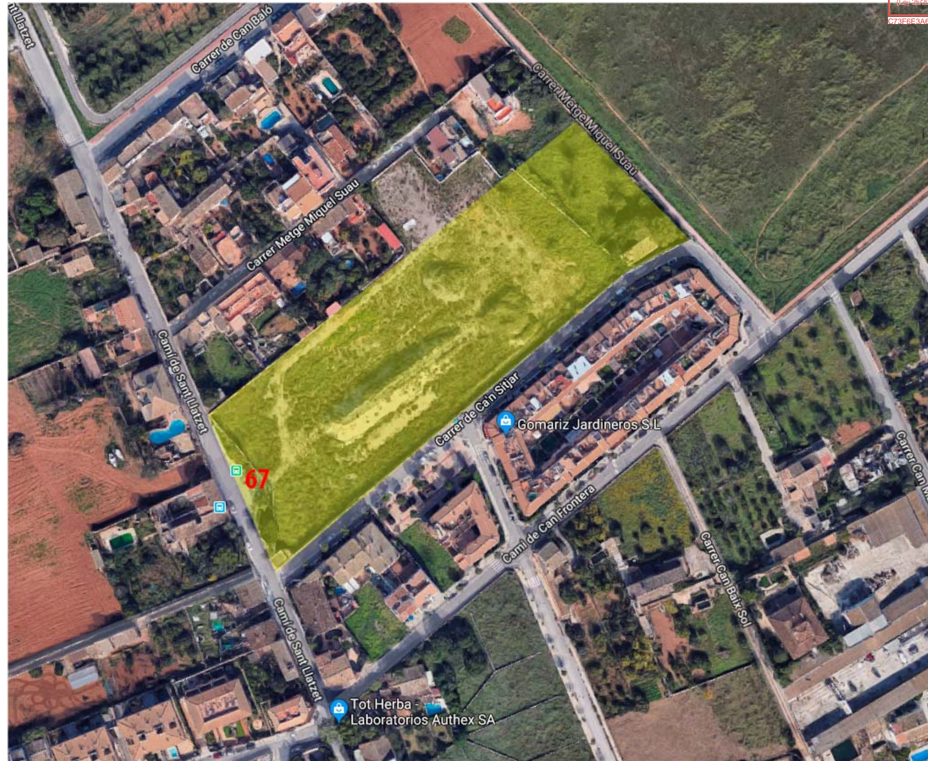
Camí de Sant Llatzet, 67. 07141 Marratxí.